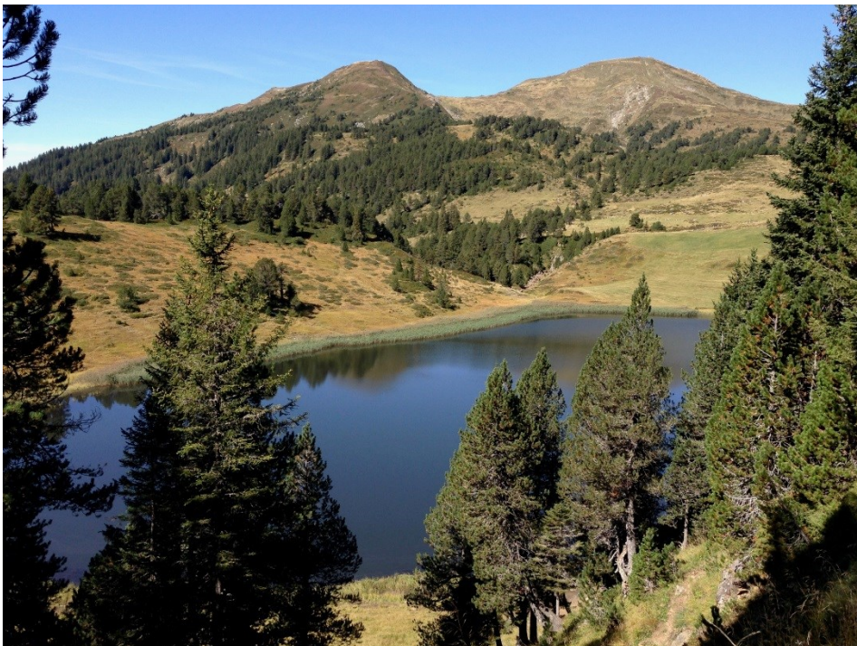
Waldreservat Glaubenberg-Fürstein: Sewenseeli mit kleinem und grossem Fürstein, auf der Grenze Luzern Obwalden

Röösl Bruno Abteilungsleiter Wald 041 925 10 71 bruno.roeoesli@lu.ch