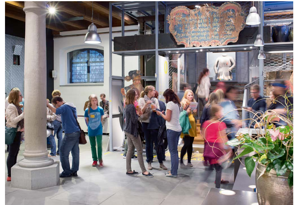
Besucherinnen und Besucher im Foyer des Historischen Museums

Detailprogramm: www.museenluzern.ch (ab April 2019)