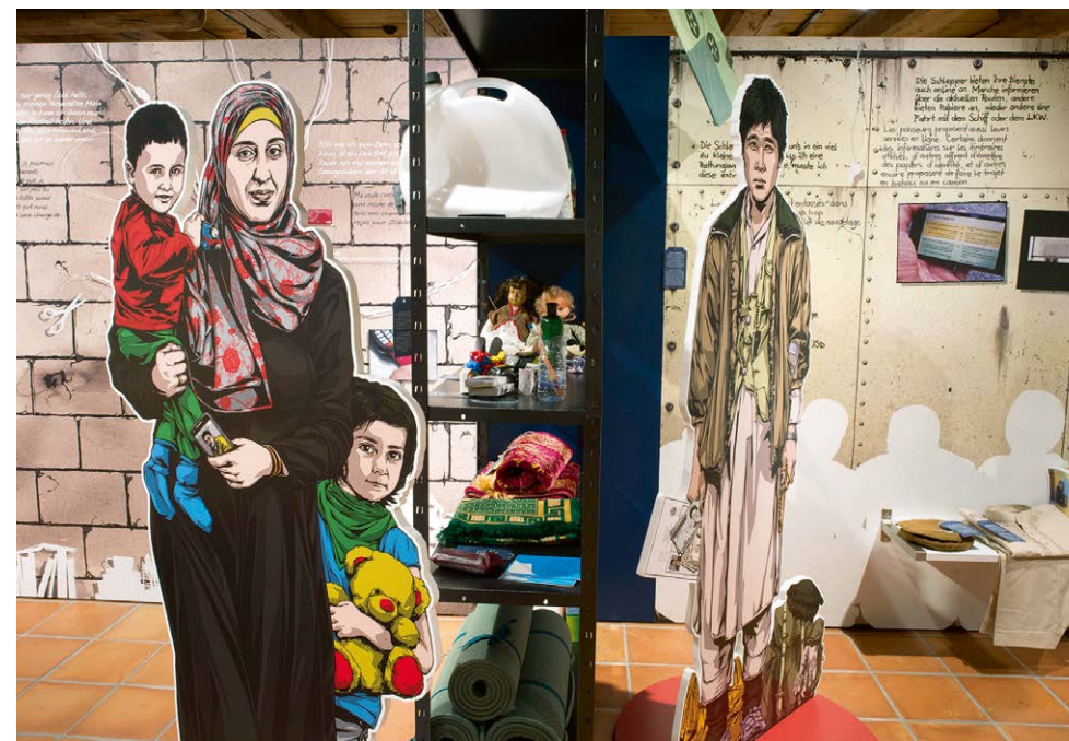
Impressionen aus der Ausstellung «FLUCHT»