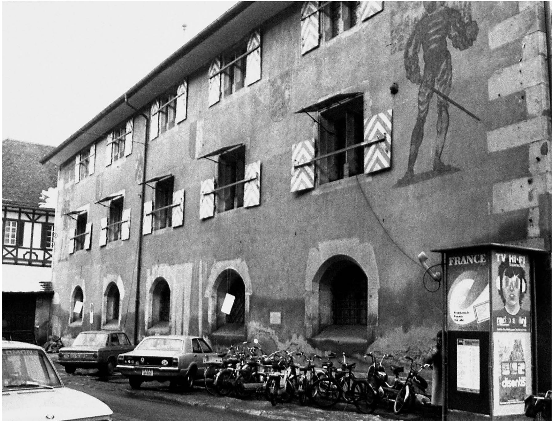
Das Zeughaus an der Pfistergasse im Jahr 1977