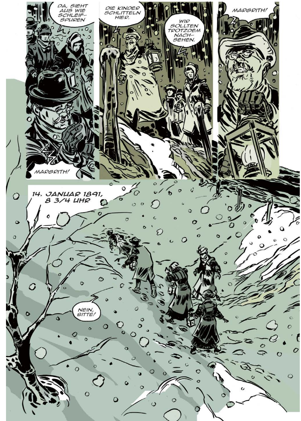
Melk Thalmann, Illustration aus der Graphic Novel «Gatti», 2018

In Zusammenarbeit mit Fumetto Comic Festival Luzern Spezialveranstaltungen: www.fumetto.ch