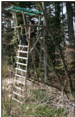
Freistehender überdachter Hochsitz mit Holzpfosten als Bodenverankerung