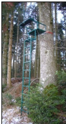
Mobile Anseleiter ohne feste Erdverbindung