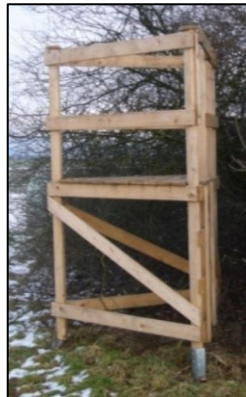
Drückjagdsitz mit metallenen Erdspiessen als Bodenverankerung