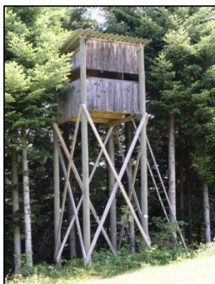
Kanzel für > 2 Personen mit Betonfundament