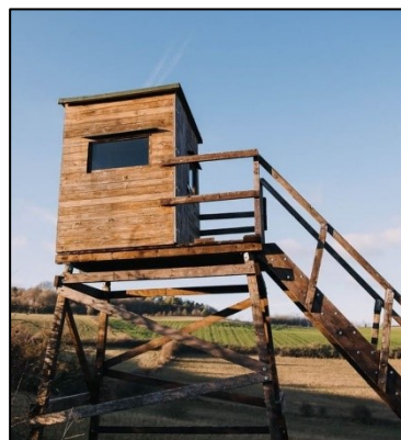
Kanzel mit Treppenaufstieg

Dieses Merkblatt tritt am 3. Juni 2019 in Kraft und ersetzt die Richtlinie vom 20. Juni 2011 sowie das Merkblatt vom Mai 2011.