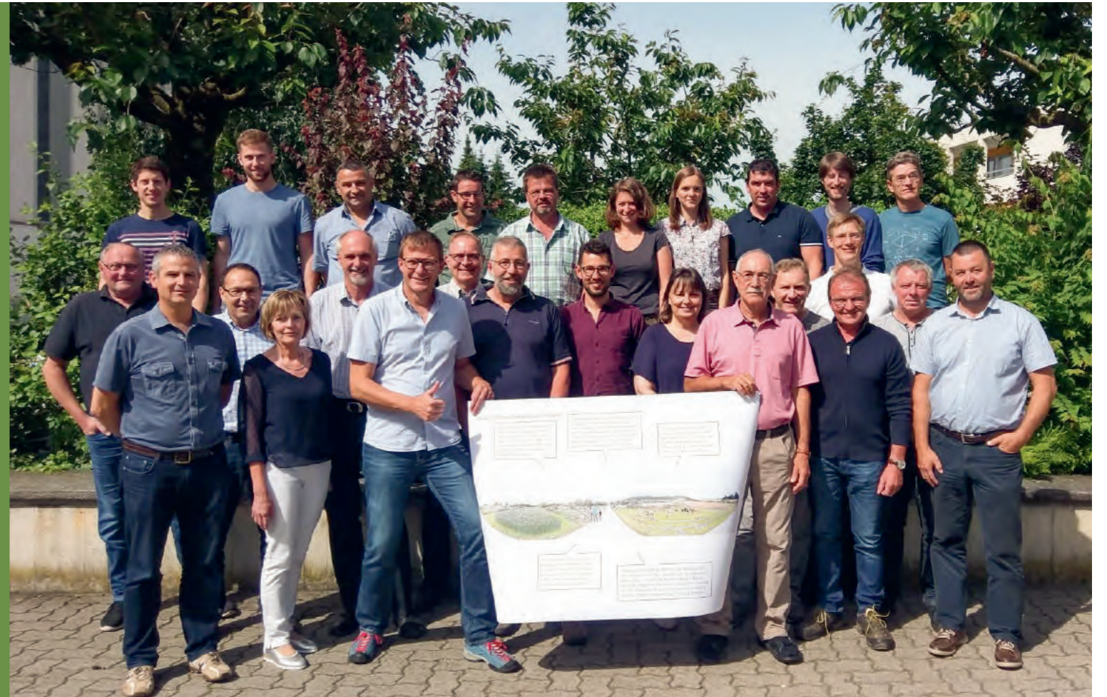
Verabschiedung Zukunftsbild der Wauwiler Ebene, Workshop 14.06.2019