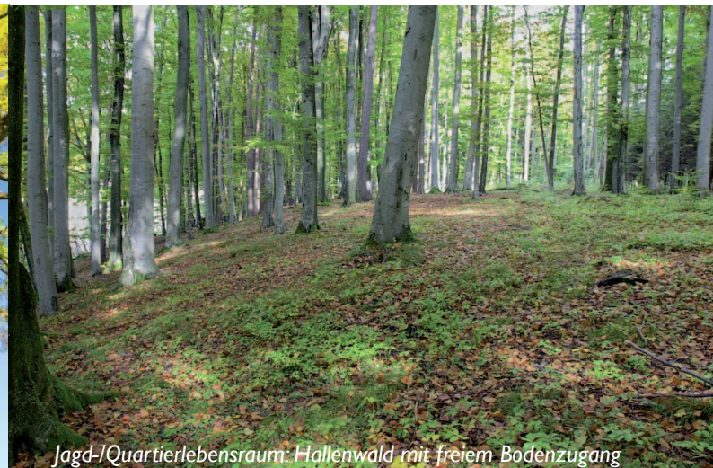
Jagd-/Quartierlebensraum: Hallenwald mit freiem Bodenzugang