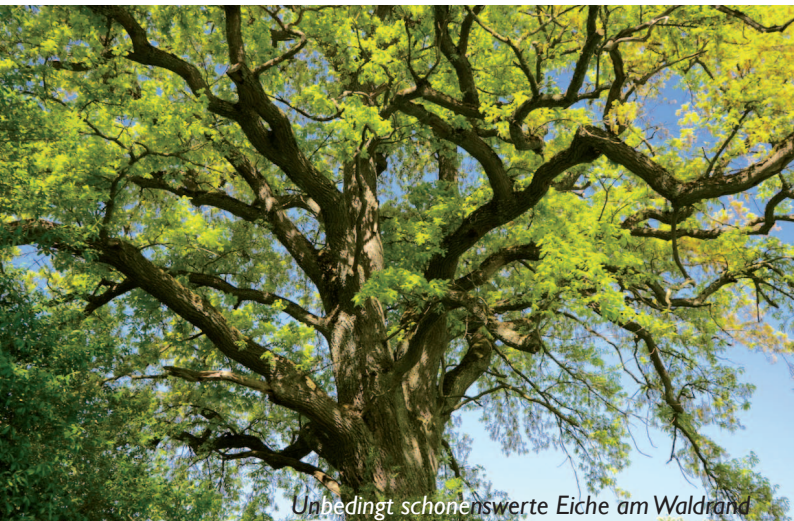
Unbedingt schone swerte Eiche am Waldrand

Vermeidung von beleuchteten Strassen, Wegen und Bahnlinien im Wald. Sicherstellung der Passierbarkeit bereits bestehender solcher Strukturen mittels überhängender Bäume, Grünbrücken oder Unterführungen. Für den Bau von Querungshilfen Beizug von Fledermausschutz-Fachpersonen zwingend.