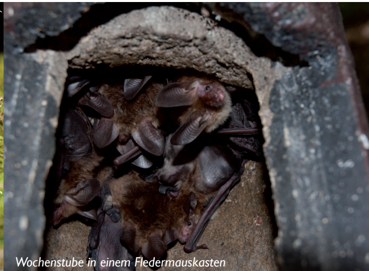
Wochenstube in einem Fledermauskasten