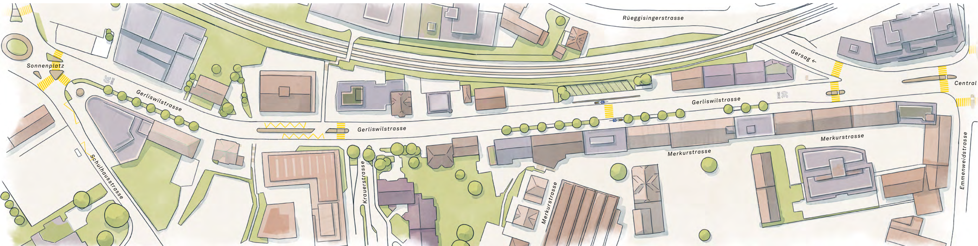
Plan unten: Sanierungsabschnitt der Gerliswilstrasse (Central–Sonnenplatz)